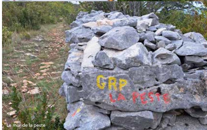
Le mur de la peste