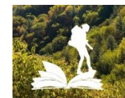
Chemin des Camisards