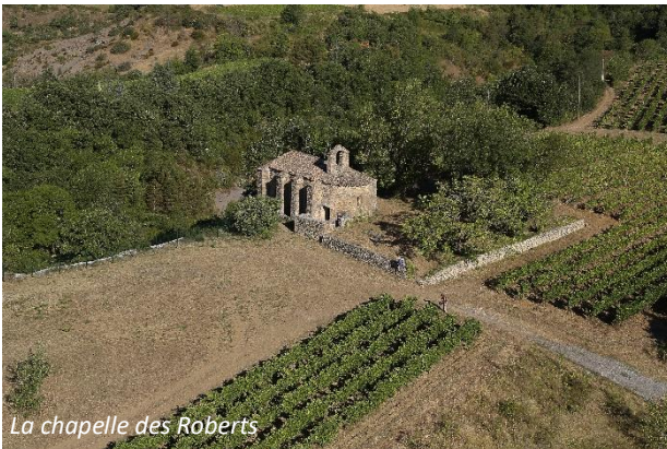
La chapelle des Roberts

De style roman (XII e siècle), cette chapelle dépendait du Prieuré clunisien de Saint-Pierre de Rompon. L'église devient temple protestant en 1560, avant de redevenir paroissiale en 1634. Cet édifice à nef unique, voûtée en plein cintre est soutenue par de puissants contreforts. Aujourd'hui elle est utilisée comme lieu d'exposition ou de rendez-vous culturels. Chapelle inscrite au titre des Monuments historiques depuis 1945.