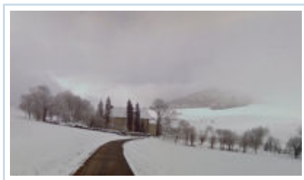
Domaine des Hautes Glaces